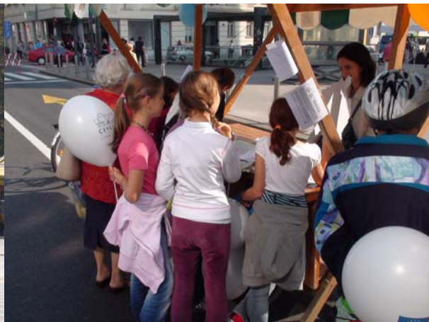
Obisk stojnice klikni svojo pot

Na stojnici smo klikni svojo pot nadomestili z dogodki povej in nariši svojo pot .