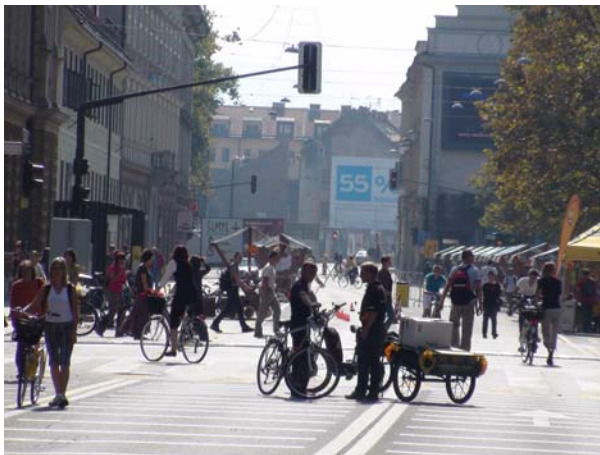
Slovenska cesta ob dnevu brez avtomobila

Projekt klikni svojo pot je imel tudi svojo stojnico na Dnevu brez avtomobila 22.09.2009 na Slovenski cesti.